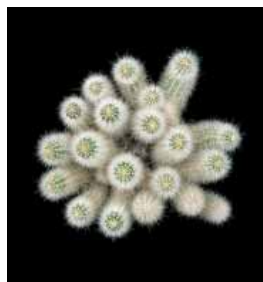
Chaque cliché rend l'infinie délicatesse de ces fleurs aux formes et aux couleurs extraordinaires.

avec volupté la splendeur de leurs détails et de leurs contours, leurs duveteuses ou épineuses textures sans compter leurs volumes étonnants fait de spirales, de volutes et de pointes.